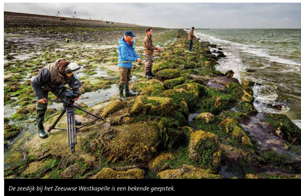
De zeedijk bij het Zeeuwse Westkapelle is een bekende geepstek.

maar een klein keelgat. Houd zo'n reepje vis daarom op maximaal 5 cm lengte en een halve cm breed. Voor de Zeeuwse wateren zijn kweekzagertjes echter het favoriete aas van de geepvissers. Prik de haak alleen door de kop van het zagertje en knijp vervolgens na ongeveer vijf