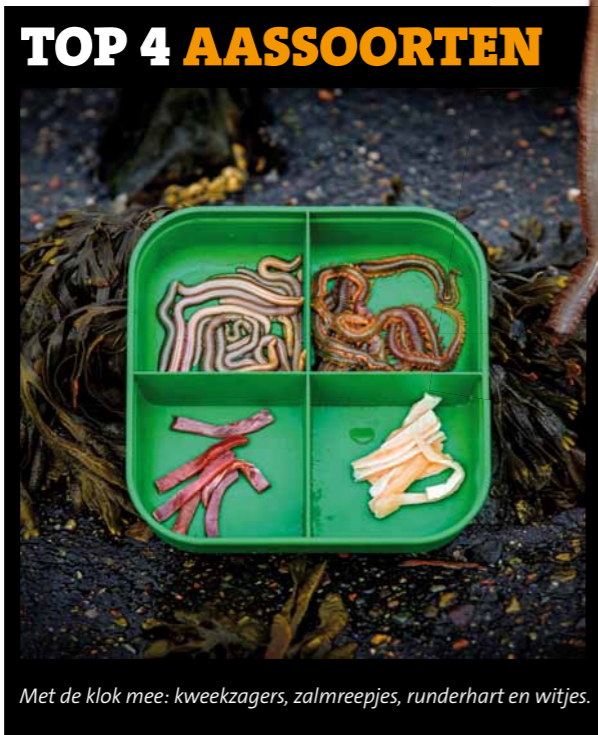
Met de klok mee: kweekzagers, zalmreepjes, runderhart en witjes.

van 30 gram aan mijn 1-ponds, 3,60 meter lange penhengel. Aan deze dobber komt ook de 1 meter lange onderlijn met daaraan de haak en het aas. Onderweg naar Westkapelle heb ik nog wat boomtakken verzameld om – zoals wij ooit in Vis TV lieten zien – in het water te gooien. Dat klinkt misschien een beetje raar, maar het is een bekend gegeven dat gepen daar als echte acrobaten steevast overheen springen. Door de straffe tegenwind en golfslag wordt het hout helaas vrijwel meteen weer op de keien aan de kant geworpen. In het geval van een vlakke zee hadden ze vandaag echter zeker extra amusement opgeleverd.